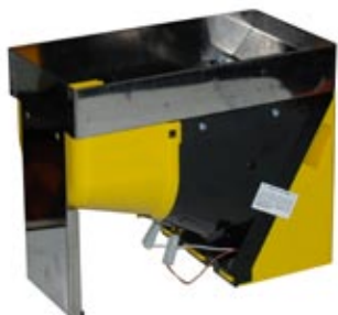
1 Hopper CD Max